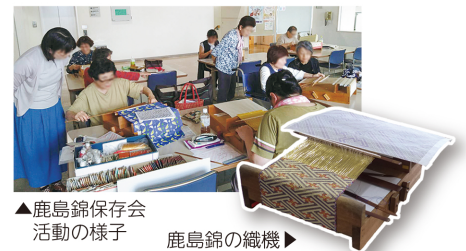
▲鹿島錦保存会活動の様子

前期はバッグ、雅袋、舞扇入、後期は茶道具、風炉先屏風、能面袋、笛袋などを展示します。ぜひ、ご覧ください。