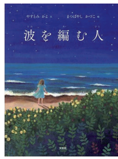
『波を編む人』文芸社 やすとみ かよ:文 まつばやし かつこ:絵