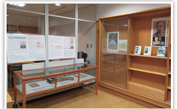
【地域資料コーナー】