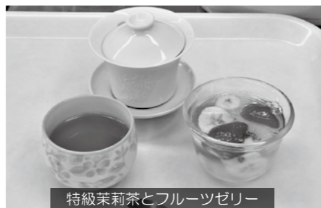
特級茉莉茶とフルーツゼリー