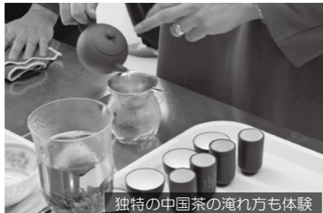
独特の中国茶の淹れ方も体験