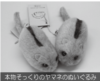
本物そっくりのヤマネのぬいぐるみ

講演では、先生がヤマネに出会うまでの経緯や、ヤマネが佐賀にたどり着くまでの話をされました。専門的な調査の話を知りやすく話され、子どもたち熱心にメモを取っていました。暖かくなった春頃に「ヤマネの観察会」も実施予定です。