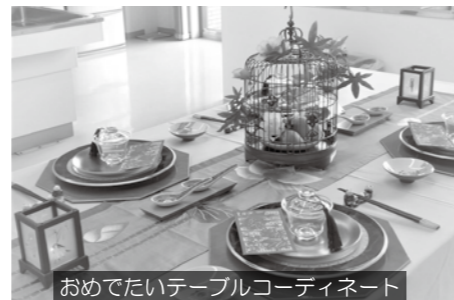
おめでたいテーブルコーディネート

テーブルコーディネートは、紅包（ホンパオ）という日本でいうお年玉袋や、蓮の花のテーブルクロス、赤いタッセルを付けた透明の茶器、おめでたい言葉の書かれた小物などで飾り付けられています。急須や茶器自体を温めたり、香りを楽しむための茶器を使ったり、ひと手間加えて普段とは違うお茶の楽しみ方をしました。