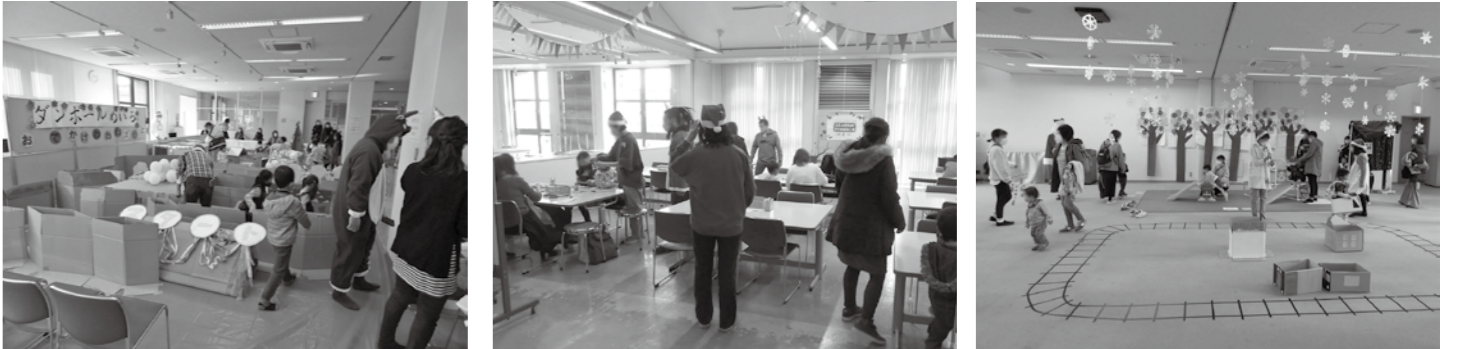
ダンボール迷路で遊ぶ

当日は映画にいられた方も含め、エイブルは親子連れでにぎわいました。2階事務局前には大きなダンボール迷路が出現。生活工房の制作コーナーでは、クリスマスモビール作りや、図書館の「プチおはなし会」も行われました。研修室の遊びコーナーでは、的当てやワニ叩き、大きな万華鏡、すべり台、電車ごっこなど、参加人数の制限はありませんでしたが、たくさん親子連れが楽しんでいました。