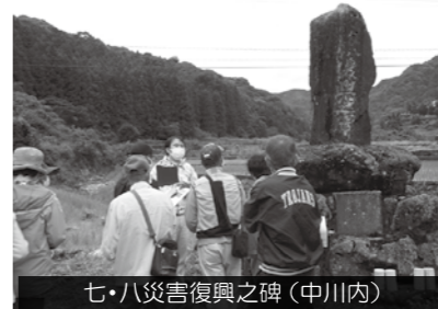
七・八災害復興之碑(中川内)