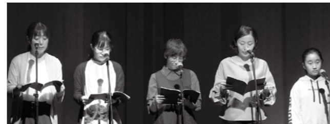
地元参加者が真剣に演じます。