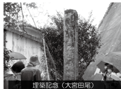
埋築記念(大宮田尾)

10月21日(木)えいぶる講座「災害石碑をたずねて」を開催しました。10時〜東部コース、14時〜西部コースの二つのコースで、現地をバスで巡りました。新型コロナウイルス感染拡大防止のためバスの定員は半分で行いました。