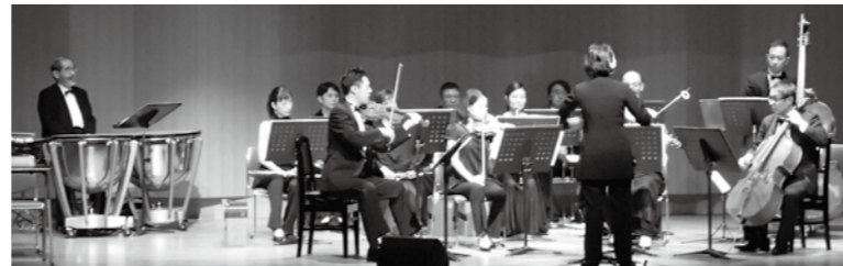
長崎 OMURA 室内合奏団による演奏

今回の地域住民参加型のイベントが、コロナ禍ではなく満員の会場で行えていたらと残念でなりませんでした。