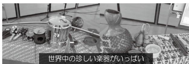
世界中の珍しい楽器がいっぱい

例年音楽室で行っていますが、今年は新型コロナウイルス感染拡大防止のため、各小学校の体育館で行いました。始めにヤヒロさんによる世界の打楽器の演奏と解説。ブラジルの弓のような楽器ピリンパウやアフリカの太鼓ジャンベなど、楽器演奏だけでなく地図を使ってそれぞれの土地の生活も紹介してもらいました。