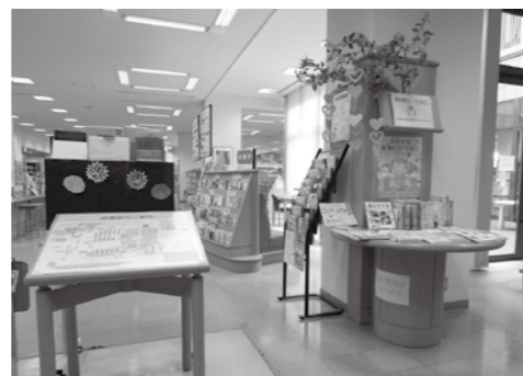
▲玄関正面入り口右のテーマ展示