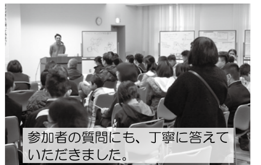
参加者の質問にも、丁寧に答えていただきました。

ムツゴロウは他にもいろいろ使われているので、サーガくんを採用して、B案:本を読むサーガくん の2案ができました。この後さらに手を加えて完成作が近々図書館に登場する予定です。また次作『なんてこった! ざんねんなオリンピック物語』が2月末に出版とのこと、こちらも楽しみに。