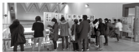
当時のレコードなどの展示を見る来場者

エイブルでの上映を望む声が多く寄せられ、今回の上映が実現しました。ホール前には関連書籍や懐かしいクイーンのレコードを展示し、当時を知る人も、初めての人も展示を見ながら思いを語っていました。