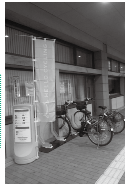
エイブル駐輪場のレンタサイクル