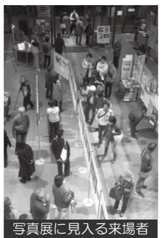
写真展に見入る来場者

ライブは、「ごあいさつ」というアルバムの冒頭を飾る同名曲で幕を開け、のっけから素晴らしいハーモニーとアコースティックギター3本のパワフルなアンサンブルで観客を魅了しました。アンコールでは鹿島に住んでいたころを歌ったとされる「自転車に乗って」を、観客と一緒に歌い、会場全体が一体となり、この日一番の盛り上がりを見せ終幕となりました。