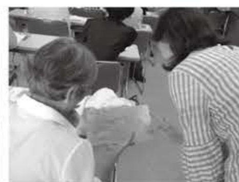
▲銅版につけられた地紋に触れる参加者