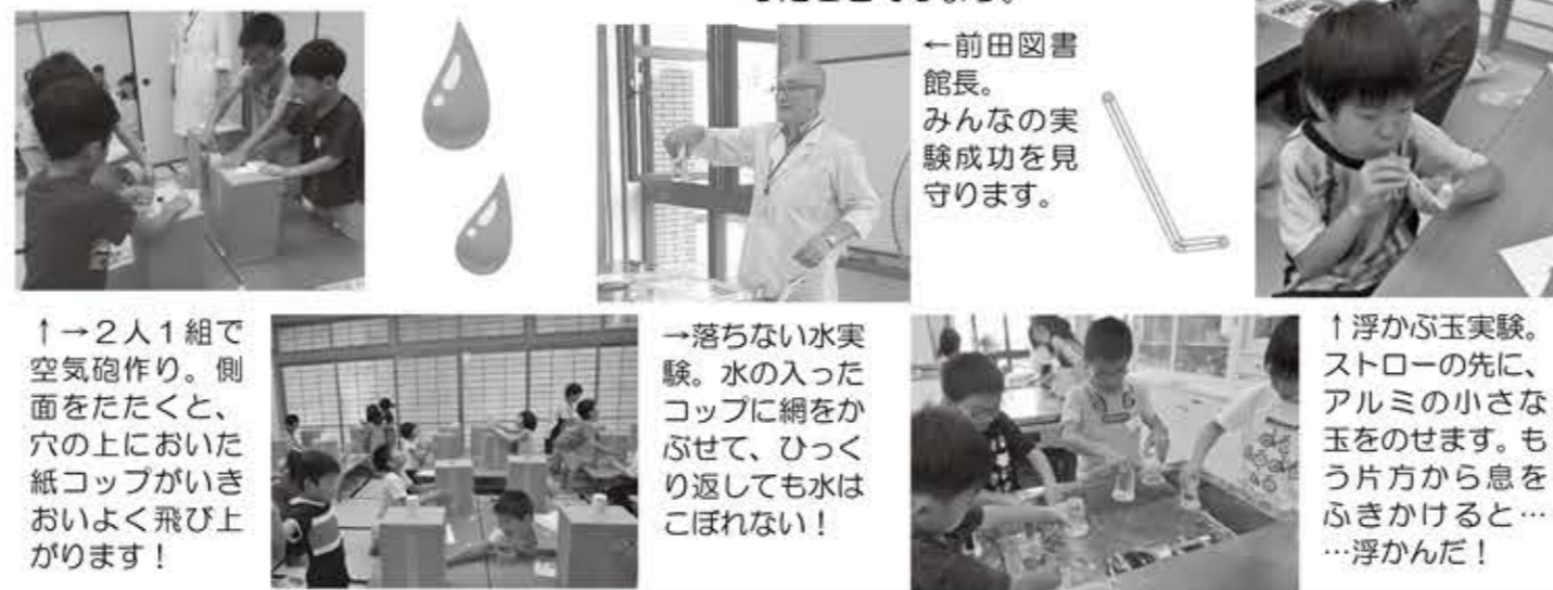
↑2人1組で空気砲作り。側面をたたくと、穴の上においた紙コップがいきおいよく飛び上がります!

夏休みのお楽しみ☆理系の図書館長による「わくわく理科教室」を8/18(日)に行いました。子どもたちは3つの実験をとおして、科学の楽しさを感じたことでしょう。