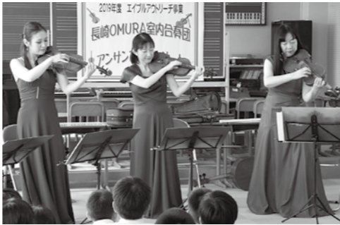
▲バイオリン、ピオラによるピチカート