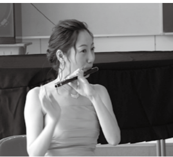
▲小さなピッコロの演奏