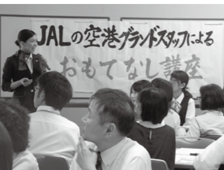
▲講師のお二人が質問に答えてくれました

エイブルパートナー企業（当財団 法人会員）をはじめ、鹿島商工会議所メンバーの企業、鹿島市役所より78人の参加がありました。年代も20代から60代まで、普段のえいぶる講座とは違って幅広い年齢層の方に参加いただきました。中には「新人の研修を兼ねて参加しました。」と、新入社員の方と一緒に出席された人事担当の方もいらっしゃいました。