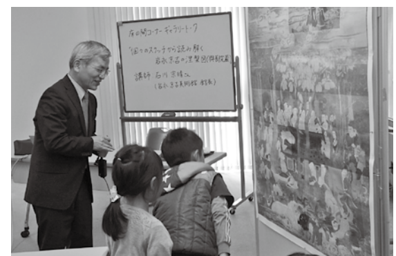
▲トーク終了後、子ども達にも優しく解説