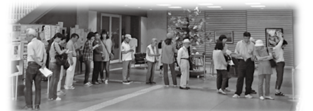
▲ 昨年の様子 ▼