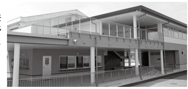
★4月13日（土）干潟体験の拠点となる『干潟交流館』（愛称：なな海）がオープンしました。