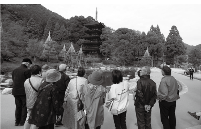
▲瑠璃光寺にて（ボランティアガイドの説明を聞く）

行程 鹿島発 ⇒ 佐賀発 ⇒ 昼食（長州苑）・瑠璃光寺・雲谷庵 ⇒ 山口県立美術館 ⇒ 佐賀着 ⇒ 鹿島着