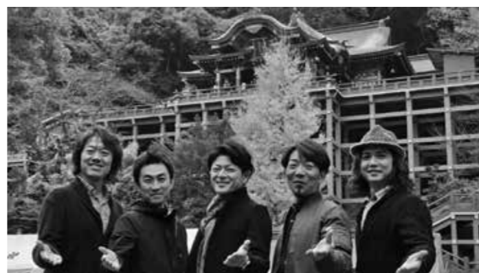
訪問コンサートの後、メンバーの皆さんは祐徳神社や有明海など、鹿島市内をミニ観光して鹿島ツアーを終えられました。