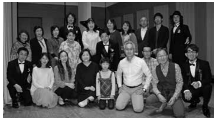
今回公募したコーラスメンバー17人と、ステージで共演。「鹿島市民の歌」を含む3曲を歌っていただきました。▲出演者全員で記念撮影

11月17日（土）エイブルホールにて「ベイビー・ブー うたごえ喫茶音楽会 ～童謡から歌謡曲まで日本の名曲を唄う～」を開催しました。ベイビー・ブーの美しいハーモニーが会場に響き、「うたごえ喫茶世代」だけではなく老若男女が楽しめる素敵なコンサートになりました。実はベイビー・ブーの皆さんは、高校の芸術鑑賞会で市民会館に来られて以来、2度目の来鹿でした。