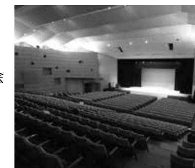
▲市民会館 大ホール 929席