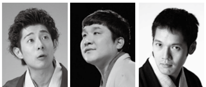
柳亭小痴楽 瀧川鯉八 神田松之丞

日時/2019年2月9日(土) 14:00開演(13:30開場) 場所/エイブルホール 全席自由 料金/大人2,500円 高校生以下1,000円