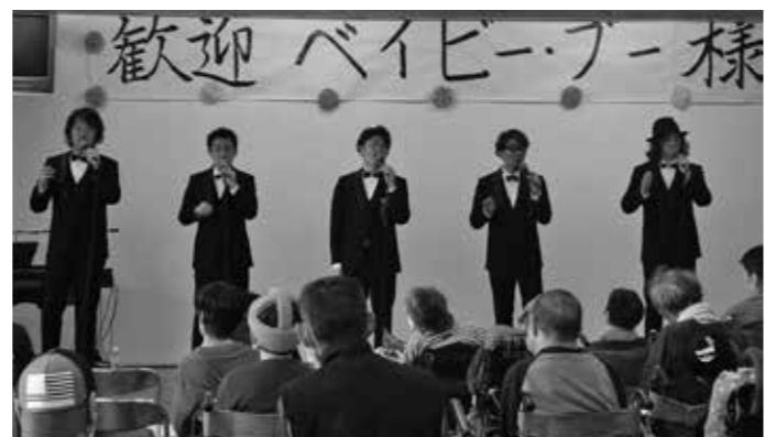
翌18日（日）には鹿島療育園へ「訪問ミニコンサート」に行き、入園者さんや職員の方々に素敵な歌声をお届けしました。