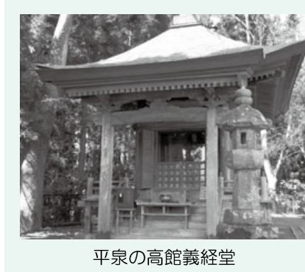
平泉の高館義経堂