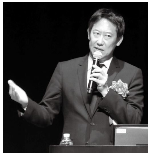
▲鈴木大地スポーツ庁長官