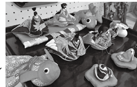
「フラ ハラウ ナー ホク リッイ」さん