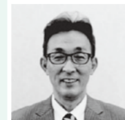
館長 守 永池

《床の間コーナー》2階エレベーター前 エイブル・公民館連携展示 かしま再発見展 ～能古見編～ 1～3月の床の間コーナーは、鹿島の6地区ごとにその歴史・文化・人物等を紹介する「かしま再発見展」の3回目として、能古見地区の展示を、床の間コーナー・鹿島市民図書館・能古見公民館で行います。能古見地区は古代から中世にかけて、能美郷と呼ばれていました。近世に入ると、鹿島藩領、佐賀藩領(本城・白鳥尾、蓮池藩領、伏原、嬉野領)・浅浦、深江領(南川・山浦、川内)の5つに分かれてしまいました。これらの地域をつないでいたのが、多岐岳山麓に源流をもつ鹿島川水系(黒川・浅浦川、中川水系、石大津川水系)の3つの河川です。エイブル床の間コーナーでは、能古見地区の歴史・文化・美術・人物に関する史料などを展示、また鹿島市民図書館では、能古見で詠まれた漢詩・和歌の史料、パネルを展示します。能古見公民館では県立図書館蔵古地図の複製パネルを展示します。ぜひご来場ください。