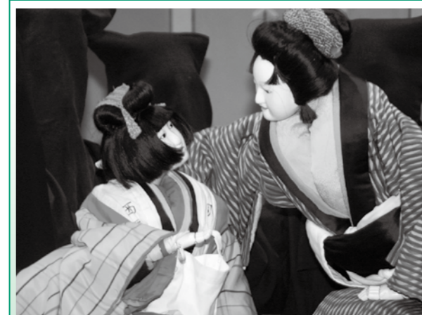
「シテ、その親たちの名は？」「アイ、父様の名は十郎兵衛、母様の名はお弓と申します。」