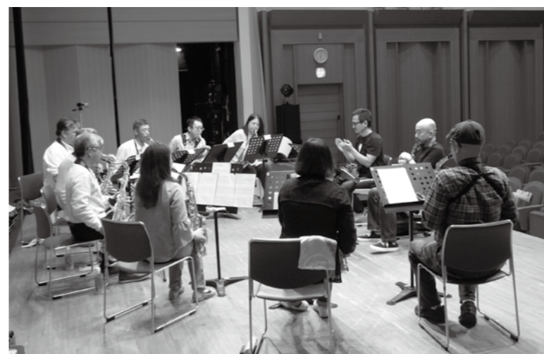
▲舞台上で直接指導を受ける参加者の皆さん