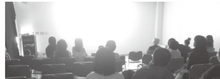
▲マット敷きのキッズスペースは椅子席の前方に設置

豪田トモ監督の前作「うまれる」は、鹿島市民図書館にてDVDを借りることができます。