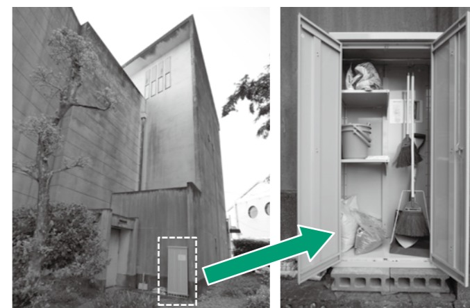
▲倉庫は、市民会館ホール非常口外にあります。

「にじいろ花だん」（市民会館の周りの花壇）は市民のボランティアの方のご協力で、いつも美しい花を咲かせています。今回園芸用具を収める倉庫を市民会館横に設置しました。